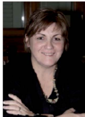
DOLDI FRANCESCA Assessore alla Famiglia, Salute e Politiche Sociali