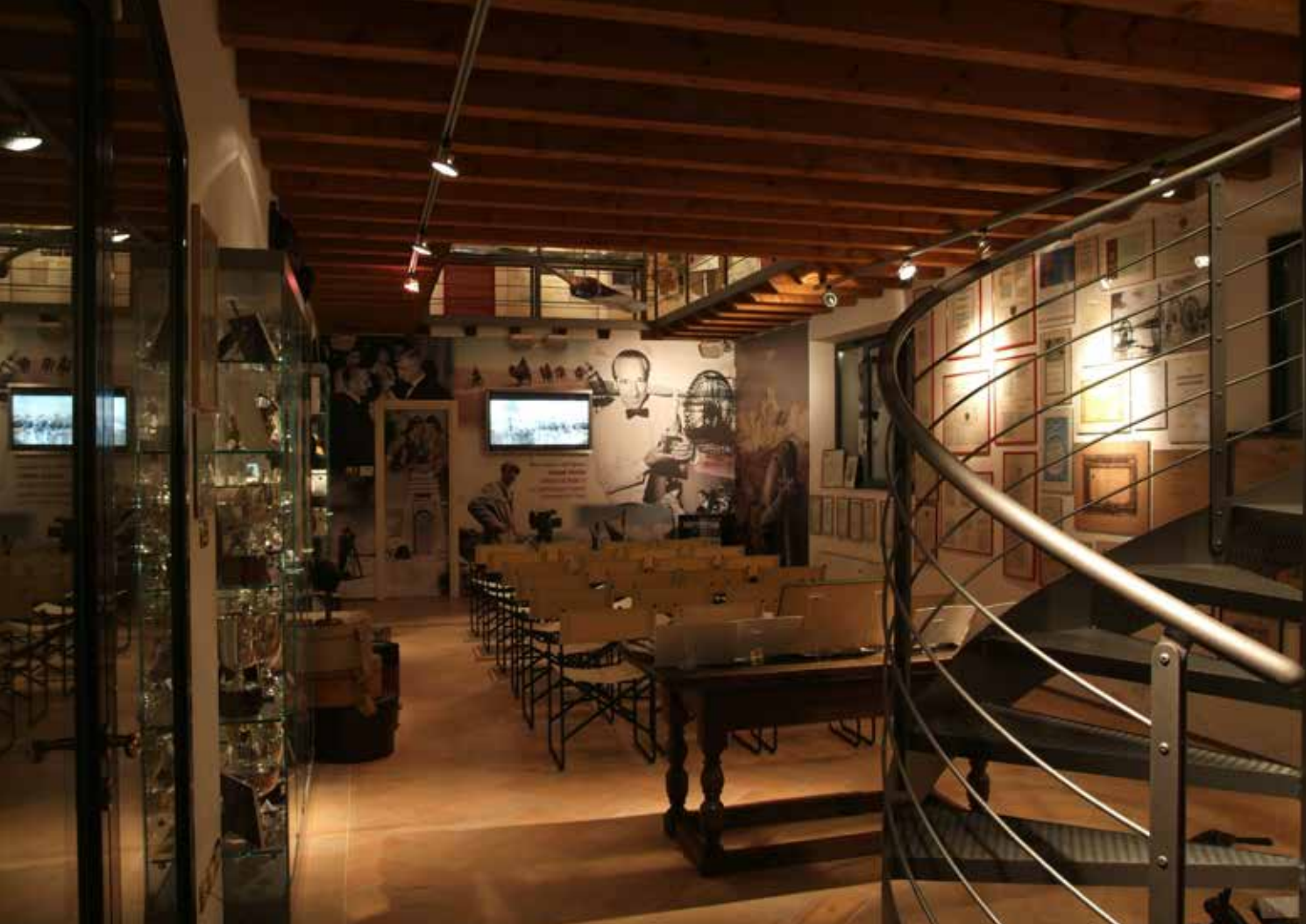
Museo Leonardo Bonzi, S. Michele di Ripalta Cremasca

Le case museo sono una realtà piccola ma importante, penso solo ai deliziosi esempi parigini del Gustave Moreau o del Nissim de Camondo. In Italia tra i tanti si distingue il Museo Bagatti Valsecchi a Milano, una piccola perla di casa museo neo rinascimentale nel cuore della città. Qui, fino al 24 giugno, in alcune sale sono esposte una trentina di teche del Museo dell'innocenza che dialogano con i visitatori in uno strano corto circuito di vero, falso, verosimile, ready made, fake news... Una visita che consiglio vivamente.