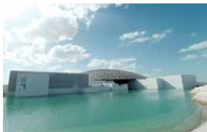
Jean Nouvel, il Louvre di Abu Dhabi negli Emirati Arabi

A surprising exhibition and an act of resistance to the system of Western museums that often sin by exaggeration, the Museum of Innocence is among the most compelling in recent years and shows us a new direction to go: the redemption of museum houses.