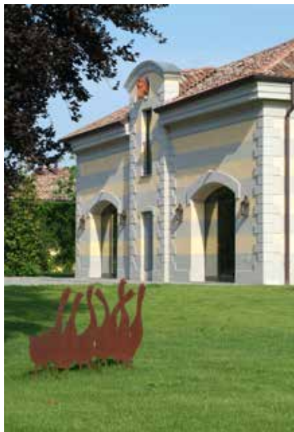
Museo Leonardo Bonzi, S. Michele di Ripalta Cremasca

Il progetto di realizzazione del museo ha previsto, oltre alle opere di restauro timido, la realizzazione di un nuovo soppalco che permettesse sia di creare un percorso di visita articolato che di aumentare la superficie a disposizione. L'allestimento del piccolo museo si accosta all'edificio esistente con discrezione, con timidezza, utilizzando materiali semplici senza prevaricare l'architettura; tuttavia possiede le caratteristiche della stratificazione, dell'aggiunta, con la possibilità futura di essere rimossa. L'aggiunta utilizza il linguaggio del proprio tempo e dialoga, applicando criteri di sostenibilità e di pudore con la materia già data, già segnata. In realtà il progetto timido ritiene più importante l'elenco delle cose non fatte.