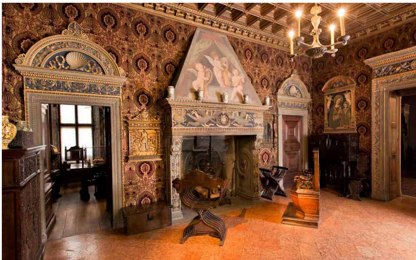
Una sala del museo Bagatti Valsecchi a Milano

Nel denunciare cosa accade spesso nei grandi monumenti-musei aveva proprio ragione Bataille già nel 1930: “Il vero contenuto di un museo sono i visitatori”. Così le grandi folle che sostano davanti ai capolavori ci fanno capire che la direzione da prendere è proprio contraria: dissolvere la folla in tanti individui con le loro storie di vita quotidiana più ricche e interessanti. In sostanza lo spazio delle case museo del futuro sarà quello di ricreare l’atmosfera del tempo in cui gli oggetti da esporre provengono e questo accade solo per mezzo delle storie personali. Così i piccoli musei potrebbero preservare la ricchezza, la bellezza, la complessità del mondo di oggi. Pamuk nel suo delizioso “Modesto manifesto per i musei” traccia le linee principali della rinascita dei piccoli musei.